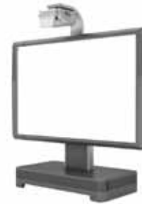
ActivBoard 300 Pro Mobile System mit EST-P1-Projektor